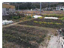
近隣の農地貸し出し可能